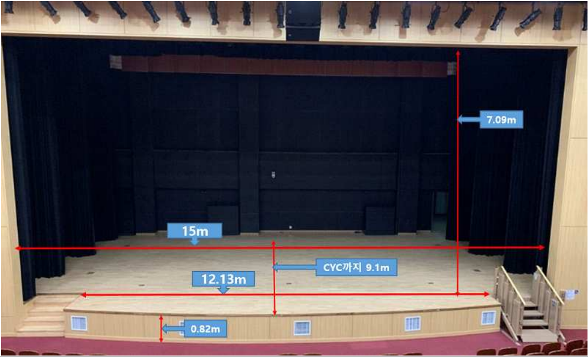
◎ 무대 및 객석(수치 표시)